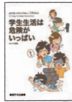
▲学生生活は危険がいっぱい