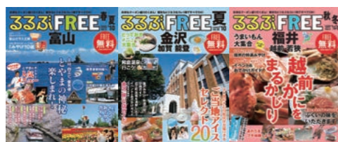
▲るぶFREE(富山、金沢、福井)