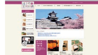
▲城下町金澤本舗(通販サイト)