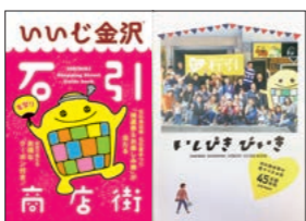
▲いいじ金沢・石引商店街