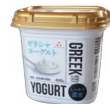
▲ホリ乳業 ギリシャヨーグルト