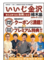
▲いいじ金沢・柿木島