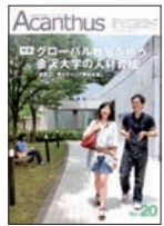
▲金沢大学 広報誌 アカンス