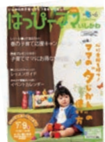
▲はっぴーママ いしかわ