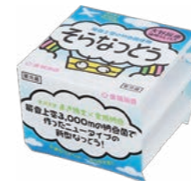
▲金城納豆 そらなっとう