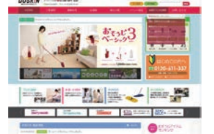
▲ダスキン北陸 Webサイト