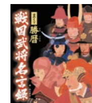
▲日めくり 勝暦 戦国武将名言録